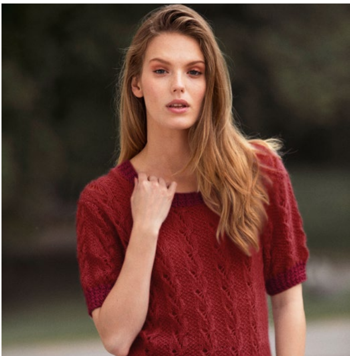
Tilhørende jumper | DSA74-05