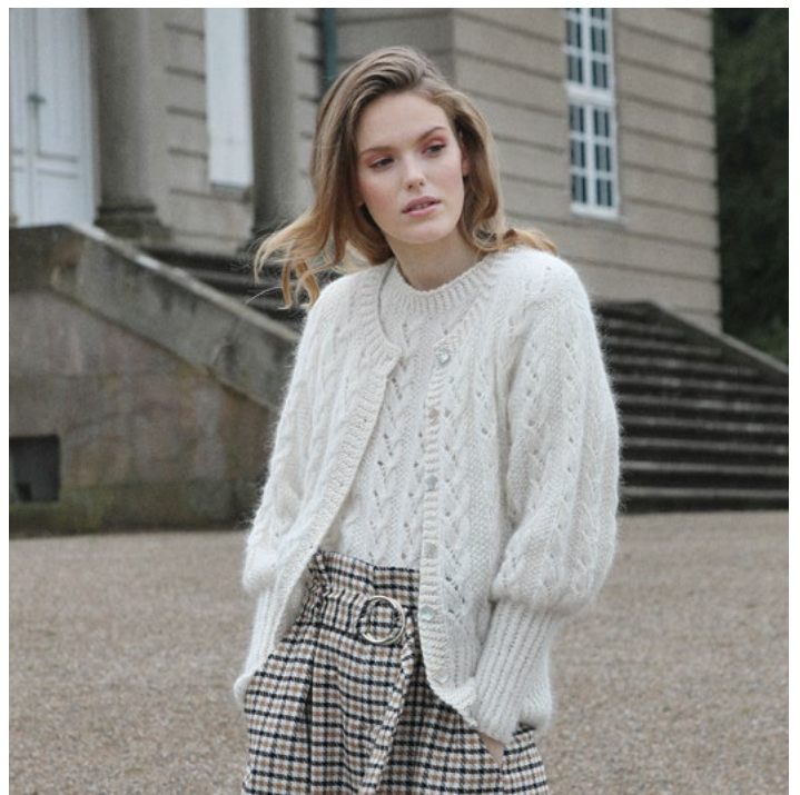
Kardigan i natur | DSA68-05