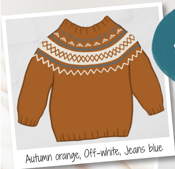
Autumn orange, Off-white, Jeans blue