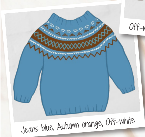
Jeans blue, Autumn orange, Off-white

Go handmade kvalitetsdesign i en unik stil