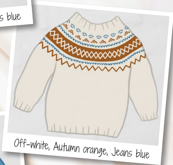
Off-white, Autumn orange, Jeans blue